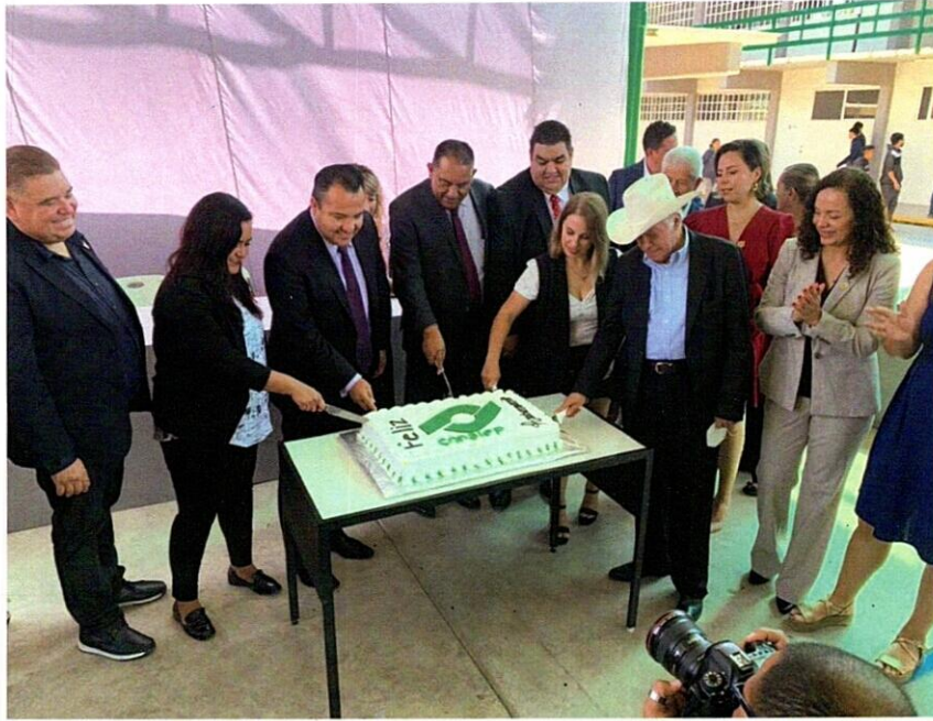
Festejo de aniversario del CONALEP EN Delicias