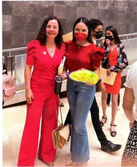
Celebración del día del estudiante