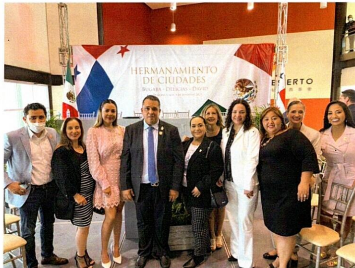
Hermanamiento de Delicias con ciudad de David y Bugaba Panamá