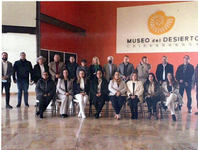
Hermanamiento con San Elizario Texas para incluir a Delicias en la ruta Camino Real de Tierra Adentro