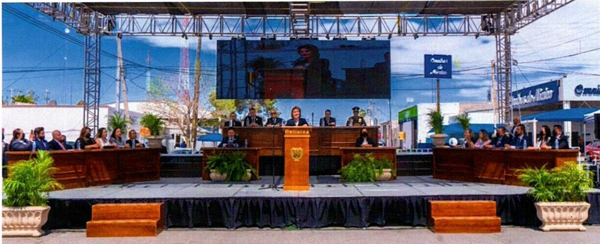
Fotografía Sesión Solemne entrega Medalla al Mérito Ciudadano Fundadores

Han sido 4 las sesiones solemnes celebradas a la fecha, me fue posible asistir a 3 de ellas, la misma semana que fui diagnosticada con COVID 19 me fue imposible asistir a una sesión ordinaria y una solemne.