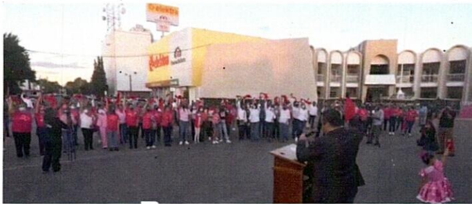
Conmemoración del día mundial de la lucha contra el cáncer